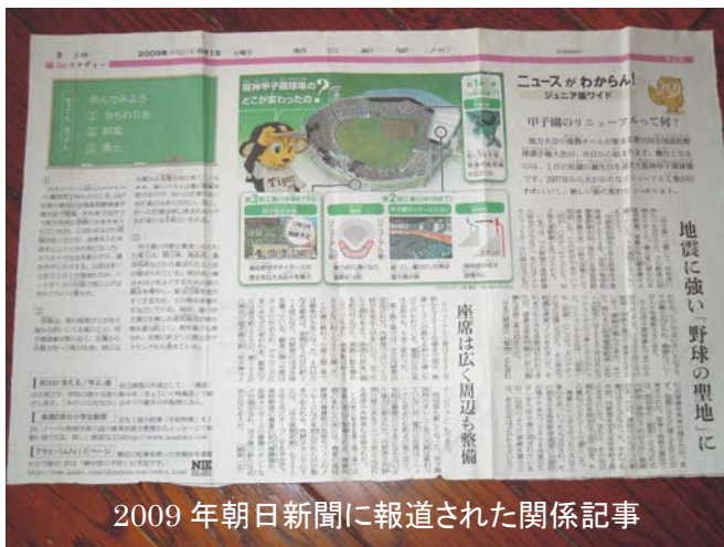
2009年朝日新聞に報道された関係記事