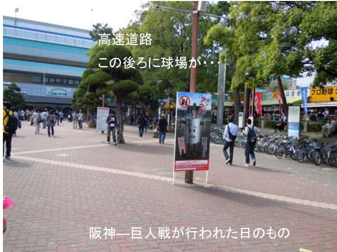
高速道路 この後ろに球場が...