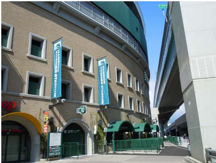
阪神—巨人戦が行われた日のもの