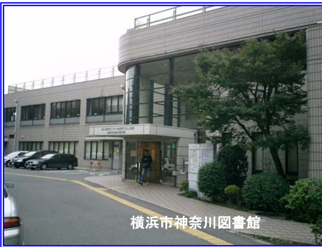
横浜市神奈川図書館

今月号には、相談役の特権で私の作品集を付けさせていただいた。これだけ立派な冊子2冊を、なんと無料でお付けしてしまうのだ。えっ、大変迷惑だって・・・。