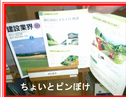
ちよいとピンぼけ