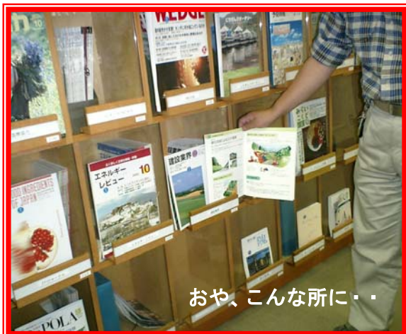
おや、こんな所に・・・

まっ、いいか。この小冊子は「建設業界」（三万部）の付録とされました。「建設業界」は全国の図書館に寄贈されています。ということは、この小冊子も・・・。見に行きました。ありました。ふふふ。皆さんが見易いように一番前に出しておきました。