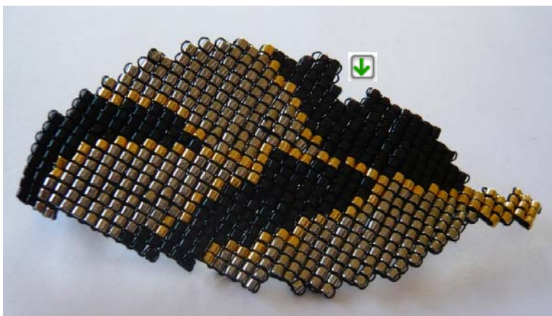
ビーズ織り教室課題 15 木の葉のブローチ