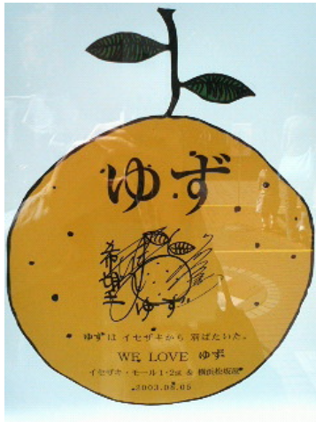
松坂屋入口にはゆずのレリーフ

もうひとつ、松坂屋といえば、ゆず。ゆずは松坂屋の前で路上ライブを始めた。紅白出場の時もここで歌った。