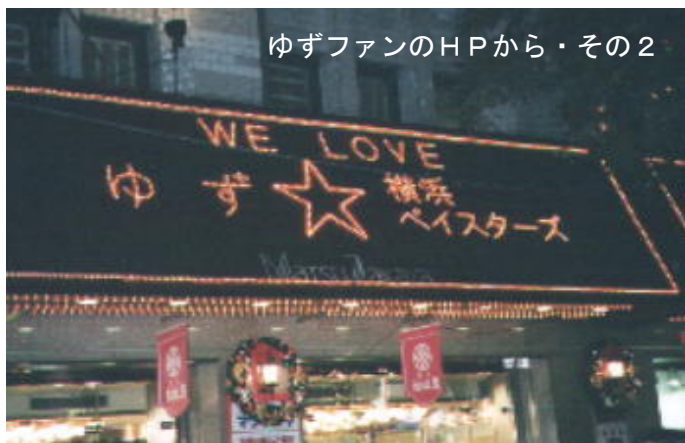
ゆずファンのHPから・その2

伊勢佐木町を進むと横浜最大のオトナの歓楽街があり、お隣のみなとみらいのお洒落で都会的なイメージとは色合いがまるで違う街。