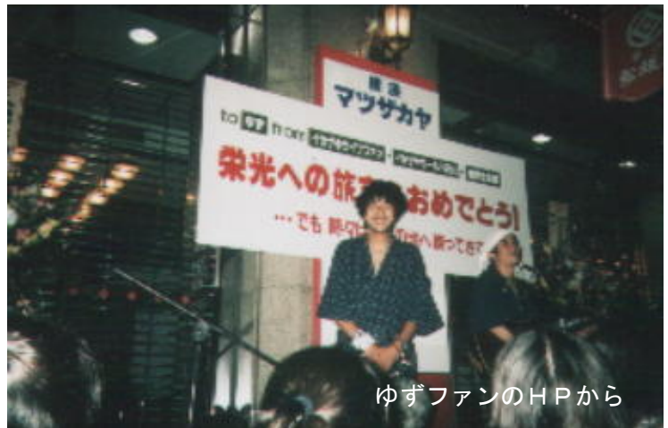
ゆずファンのHPから

もうひとつ、松坂屋といえば、ゆず。ゆずは松坂屋の前で路上ライブを始めた。紅白出場の時もここで歌った。