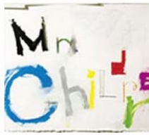
「シフクノオト」 2004・4・7