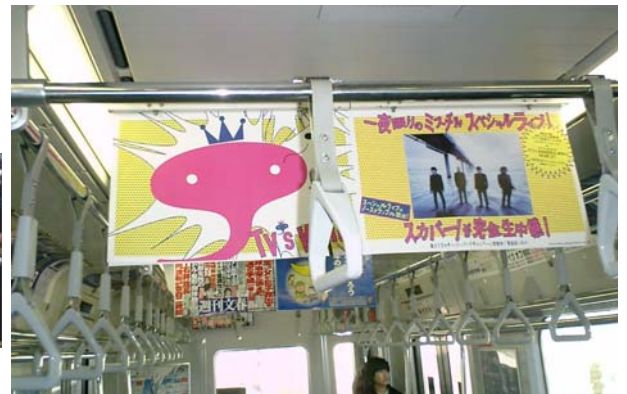
「WONDER-FUL WORLD ON DEC 21」