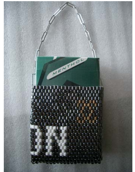
↑ お友達に頼まれて作ったリュ・シウォンの煙草ケース。シャネルマークつき。