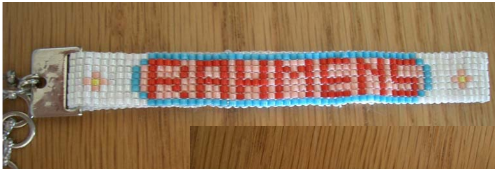
表は賢太郎、 裏はラーメンズ。 可愛い。ぐぶぐぶ