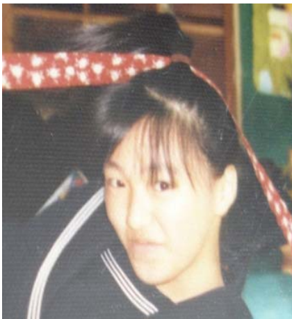
中学2年の時、教室にて。