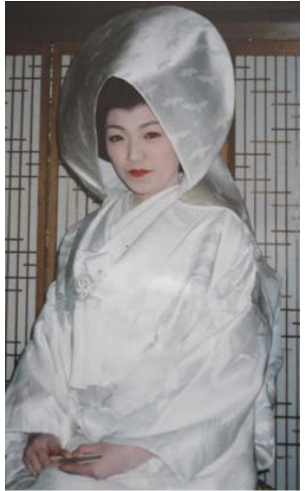
変身後☆じんじんの実家で 仏前結婚式の直前。

立派な家ではあったのですが、わたしはこの広い家があまり好きではありませんでした。16 帖くらいの自分の部屋を使うことはあまりなくて、おばあちゃんの布団に潜り込んで、一緒に寝てました（汗） 父親の事業の失敗により、ここに住んだのは 12 歳まででした。