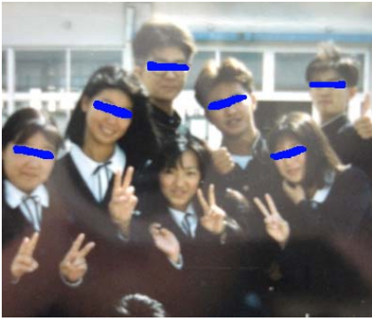
高校3年の時、渡り廊下にて。