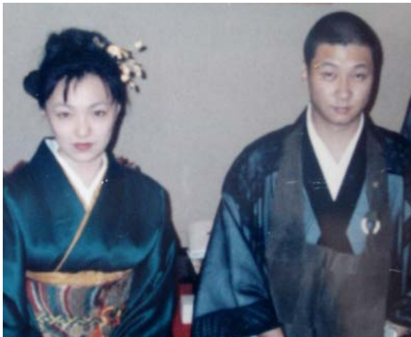
じんじんと結納、21歳の時。