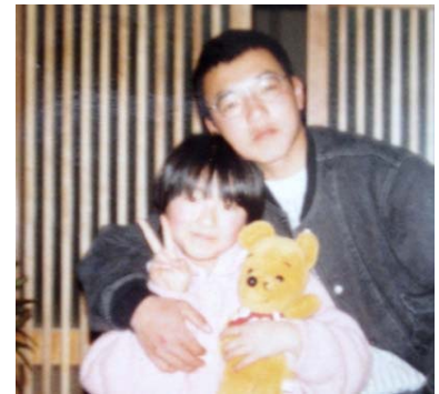
小学校2年生の時中学2年の兄と玄関にて。(見ておわかりのように丸々と太っていた)