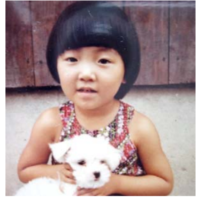
3歳頃、当時飼っていた愛犬けんたろうと一緒に。