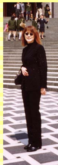
懇談会ファッション↑