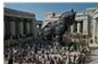
↑ 映画の木馬登場シーン。

めざましテレビによると、6月29、30日と二日間かけて各パーツごとに解体され、新宿から次の展示先トルコへと向かったそうです。足元の焼け焦げは映画での木馬炎上シーン撮影時の名残だそうで、さすがのハリウッド大作も 11 t の木馬はただひとつしかないってことらしい。撮影終了後もトロイの木馬は大忙しで世界を駆け巡ってるんですね～。