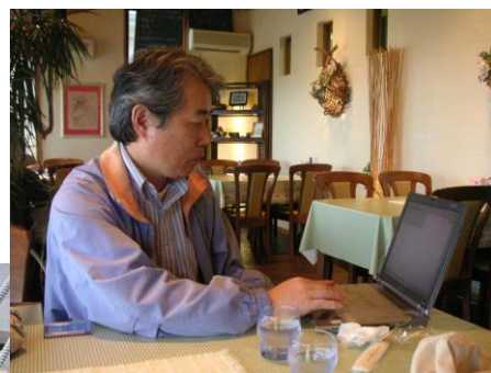
←出勤要請を待つライ隊員。